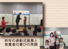
昨年の表彰式風景と 受賞者の喜びの笑顔

表彰式：2012年10月21日(日) 11:00～12:00 (展覧会：10:00～17:00) 場 所：イオンモール高崎 2階イオンホール (受賞した方には、はがきにて通知をいたします)